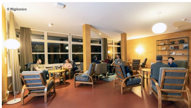
L'hôtel historique Bella Lui, repris et rénové par les Auberges de Jeunesse Suisses, privilégie les rencontres entre visiteurs de tous horizons.