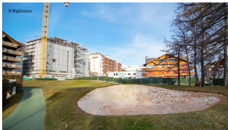
L'ancien Rhodania est en cours de transformation pour figurer dans la gamme premium de la chaîne de luxe Hyatt. Il devrait ouvrir ses portes durant l'hiver prochain.